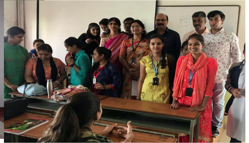
हिन्दी दिवस समारोह आयोजित।