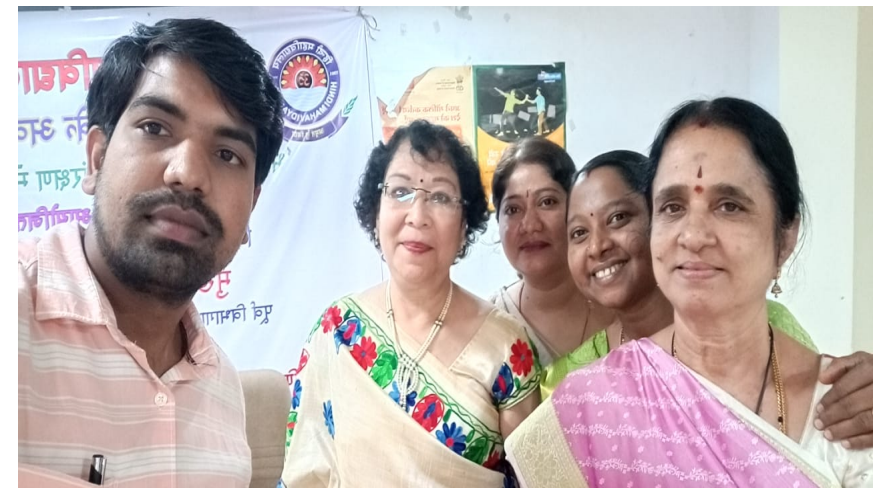
हिन्दी महाविद्यालय तथा निजाम कॉलेज के तत्वावधान में राष्ट्रीय संगोष्ठी आयोजित