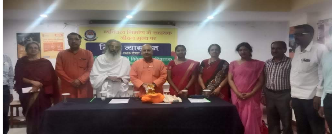
नैतिक मूल्यों पर अतिथि व्याख्यान आयोजित।