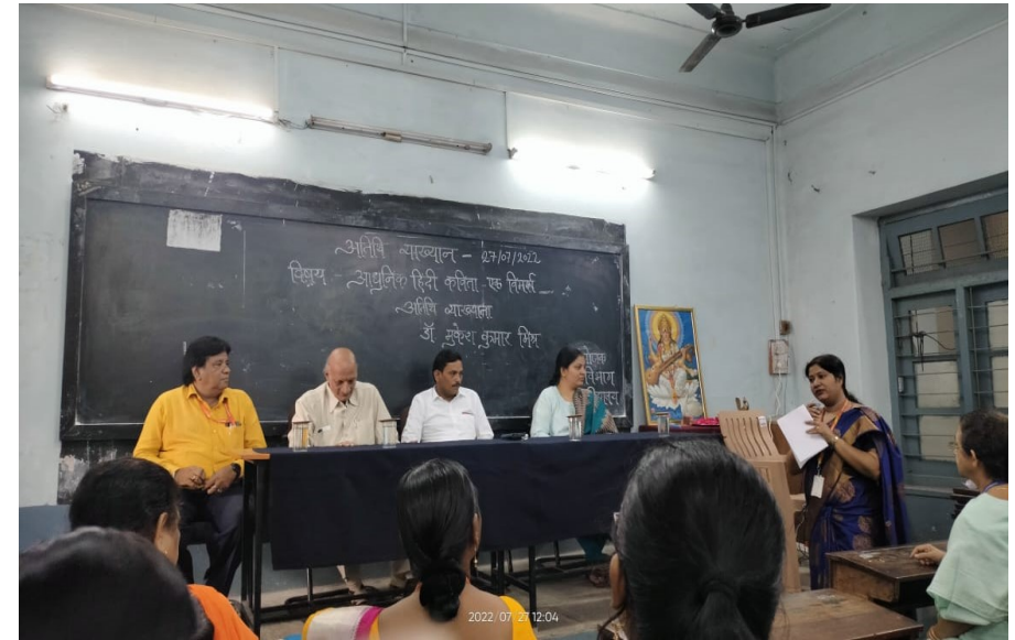
अतिथि व्याख्यान आयोजित।